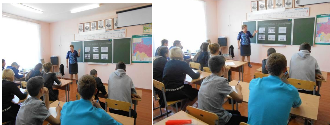
Старшеклассники участвуют в викторине «Что такое демократия?»

Цель и состоит в том, чтобы рассказать о деятельности местных органов власти и привлечь внимание граждан к тому, что их участие в местных делах является важнейшим фактором жизнеспособности демократии. Распространение информации о разных возможностях участия в принятии решений на местном уровне должно содействовать расширению участия граждан - это является главным предварительным условием для эффективного управления и функционирования местной демократии.