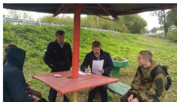
гидробиологи обсуждают результаты