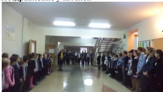
Передача учительских полномочий